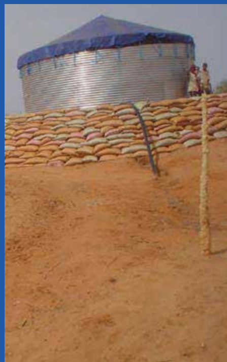
“Evaluación a las intervenciones de emergencia en Somalia”