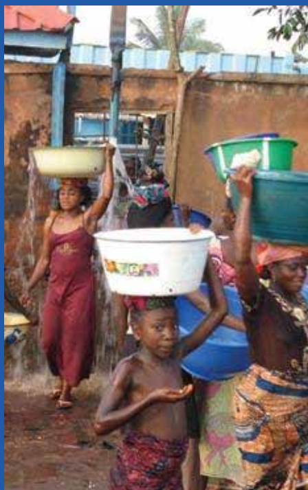
“Mejora en el acceso al agua potable en Jigawa, Nigeria”

País: Bolivia Cliente: Banco Interamericano de Desarrollo/ Ministerio de Medio Ambiente y Agua