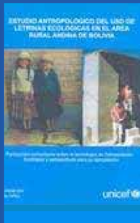
“Estudio antropológico sobre el uso de letrinas realizado por LWB en la zona andina, Bolivia (tapa de publicación)”