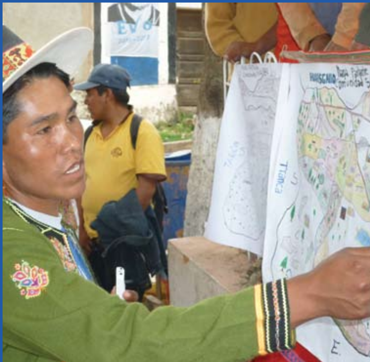
“Manejo Comunitario de Cuencas en Potosí, Bolivia”