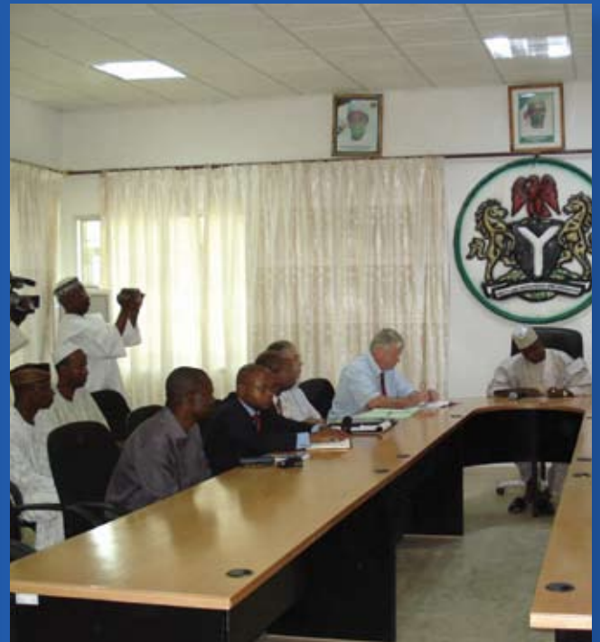
“Reunión de coordinación del WSSSRP en Kano, Nigeria”